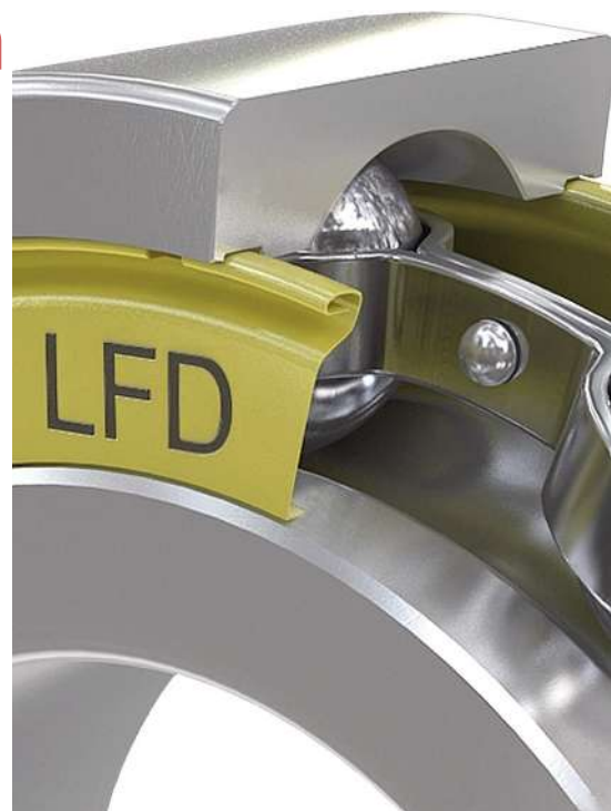
LFD-Rillenkugellager mit Blechabdeckung (Z-Scheibe)

Ventilator des Heizungsgebläses, wärmt Ihnen die Füße und nebenher ist erwartungsgemäß die Frontscheibe nicht mehr beschlagen. Sie drehen an der Lenkung, Lager helfen dabei und sie fahren los, weil Kugellager auf den Achsen die Bewegung Ihrer Räder überhaupt erst ermöglichen. Gar nicht davon zu reden, dass Lager sogar dafür eingesetzt werden, um das Logo der Automarke immer schön waagrecht in den Felgen mitlaufen zu lassen. Kurze Schaltungen vom ersten bis in den letzten Gang und schon sind Sie dank ausgefeilter Lagertechnik auf dem Weg zum Flughafen.