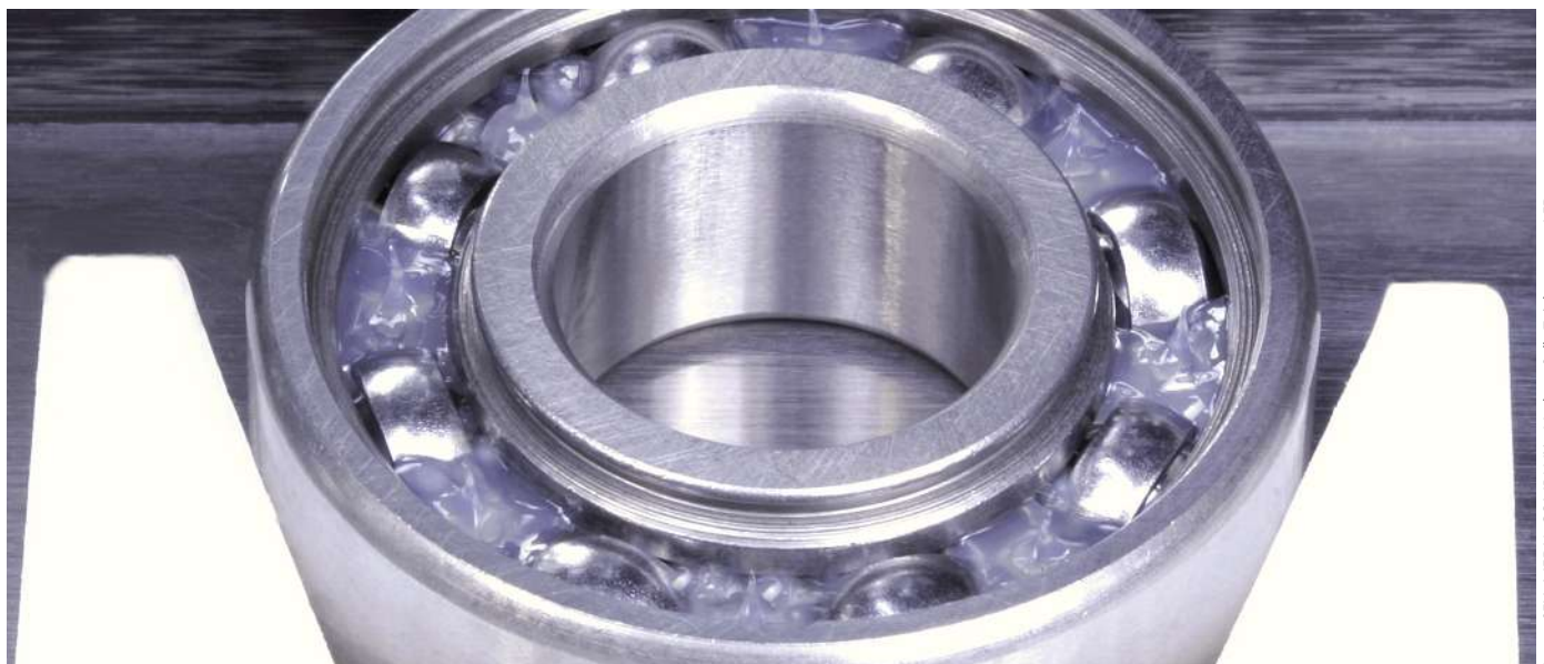
LFD-Produktion: Rillenkugellager mit Einstich am Innenring, fettgefüllt

In dieser Anwendung des klassischen Langsamläufers kommen LFD-Wälzlager mit besonders reinen Wälzlagerstählen zum Einsatz, gefüllt mit MoS 2 -additiven Schmierstoffen. So wird der hohen Kraftbelastung im Mischreibungsbereich optimal Rechnung getragen.